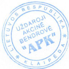
Direktorius Dainius Paplauskas